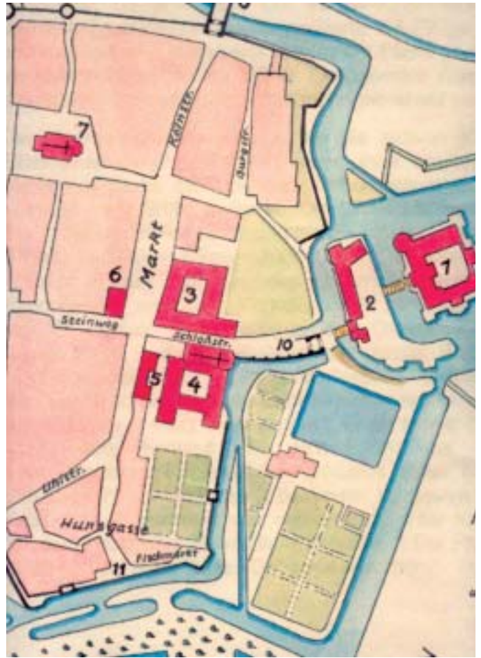
Abb. 8 Historischer Plan der Stadt Brühl unter Benutzung des Schlaunschen Planes von 1724. Nr. 5: Das Franziskaner-Krankenhaus. Zwischen Steinweg und St. Margareta (Nr. 7): Die Hospitalstraße.

In der Urkunde von 1668 ist zu lesen: Der jetzige Guardian P. Aegidius Francken ließ am äußersten Ende unseres Großen Gartens an der (Uhl-)Straße der Stadt ein Krankenhaus neu erbauen und mit allem Zubehör zur besten Versorgung der Kranken und ihrer Pfleger ausstatten