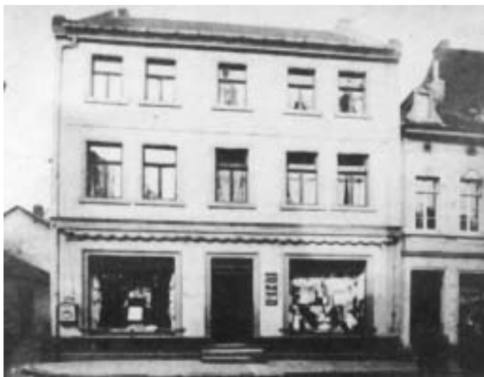
Abb. 10 Haus zum Rosenkranz. In: Drösser/Meyer, 1994, S. 3 (vgl. Anmerkung 77)

Das Ausmaß der Arbeiten führte die aktiven Mitglieder im Elisabethen-Verein an die Grenzen ihrer