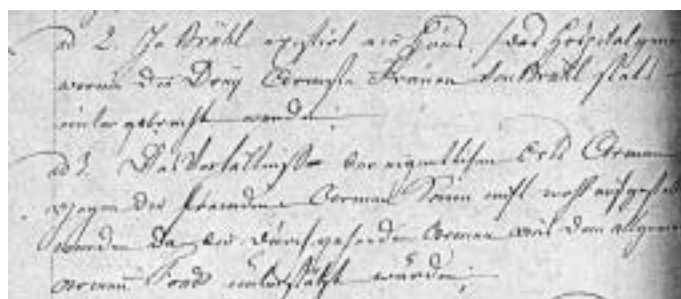
Abb. 6 Aus dem Korrespondenzbuch vom 4. Februar 1822.