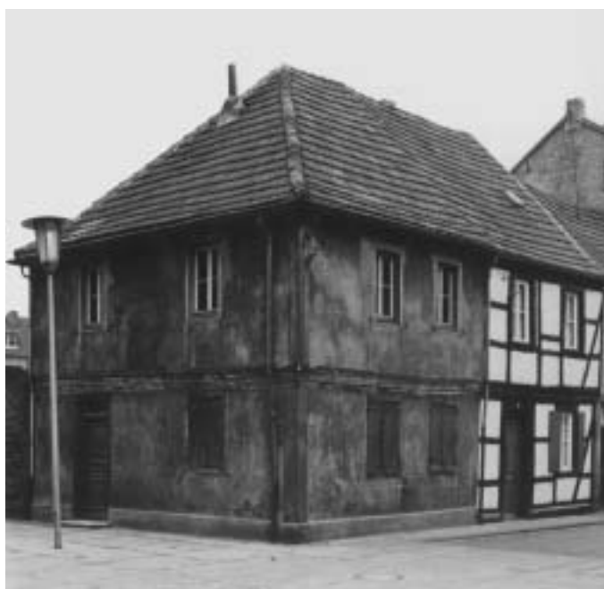
Abb. 4 Das „Hospitalchen“ vor dem Abriss.

1820 verfügte die königliche Regierung in Köln, die Unterstützung der Armen sei wieder Aufgabe und