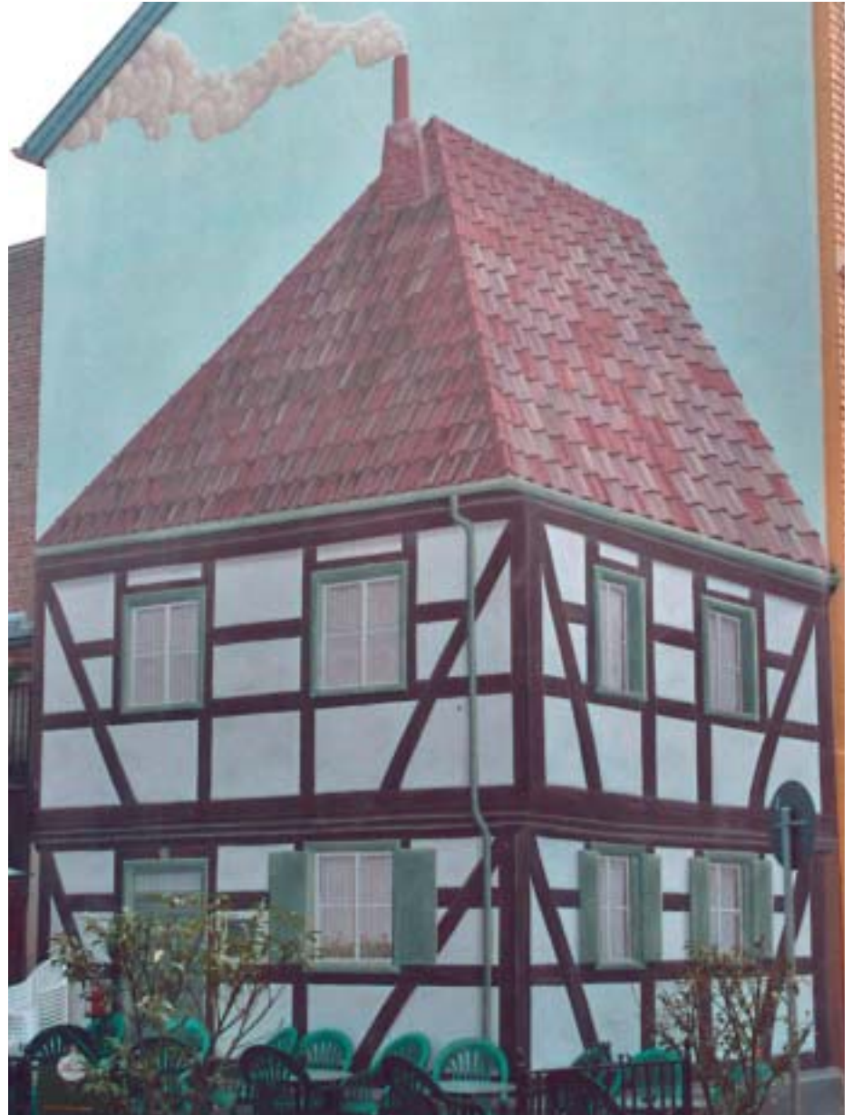
Fassadenmalerei von Hans Günther Obermeier.

Günter Krüger beschreibt das Innere des Hauses wie folgt: Im Erdgeschoss ein großzügiges, offenes Treppenhaus. Im Obergeschoss eine umlaufende Galerie, von der aus man in die Zimmer gelangte. Die ursprünglichen Zimmertüren waren noch vorhanden. Auch die Haustür