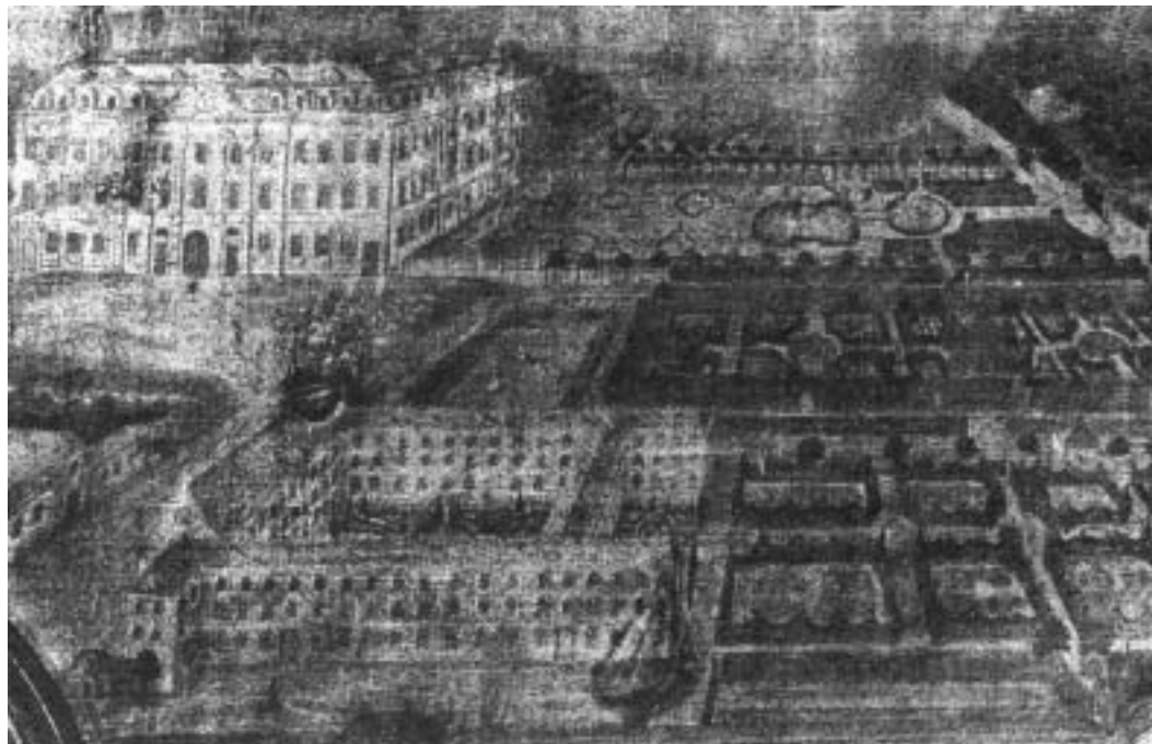
Abb. 9 Altarbild des Hl. Antonius von Padua (Ausschnitt).

Eindruck der gesamten Klosteranlage, wie sie sich nach dem Neubau 1718 66) darbot, vermittelt. Leider ist lediglich ein Amateurfoto aus den 1930er Jahren von diesem Bild erhalten geblieben 67) . Auf diesem Bild erkennt man, dass