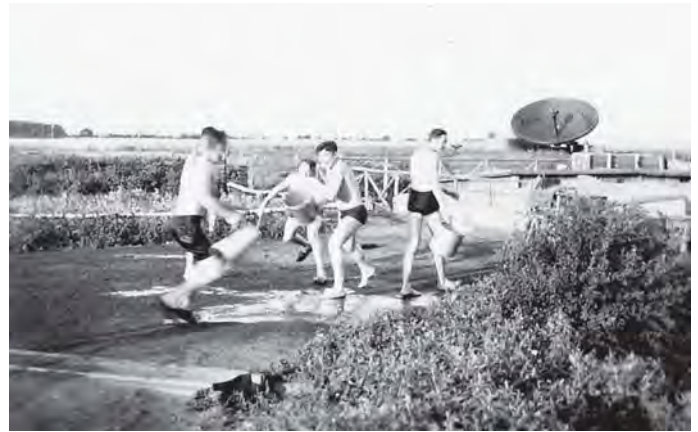
Abb. 5 Wasserschlacht in der Freizeit

Die Bauweise der Mannschaftsunterkünfte ähnelte der der Geschützstellungen, nur war der Grundriss statt 6-eckig ein lang gestrecktes Rechteck. Zu unserer Unterkunft führte eine vielstufige Treppe (vgl. Abb. 3). Am Eingang befand sich ein Waschraum: rechts und links ein Zementtrog mit jeweils drei Wasserhähnen, die natürlich nur kaltes Wasser gaben (für insgesamt 18 Mann). Daran schloss sich der Aufenthaltsraum an. Er hatte nahe unter der Decke links und rechts ein kleines Fenster und in einer Ecke zur Heizung einen Kanonenofen, in der anderen Ecke ein kleines Regal mit Fächern für das Frühstück und das Abendessen. Den Abschluss bildete der schon beschriebene Schlafbereich. Kurz gefasst: wir wohnten im Keller-