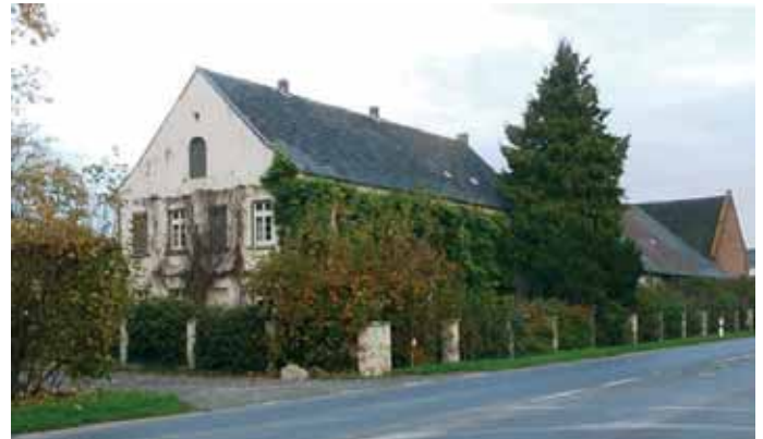
Abb. 3 Das Wohnhaus des Gutes Derkum mit der B 51 im Vordergrund. Der einstige Knippshof wird heute von der Familie Dinges bewirtschaftet.

(1884) und Jülich (ab 1929/1930) folgten, führte zu Spannungen mit der rheinischen Rübenzuckerindustrie. Angesichts der erwähnten Vergünstigungen befürchtete man hier eine Lieferantenabwerbung. Die Konkurrenz insbesondere gegenüber Pfeifer & Langen (Euskirchen und Dormagen) führte zu Gegenmaßnahmen: So wurde beispielsweise die Brühler Fabrik mit fadenscheiniger Begründung aus dem gemeinsamen Feuerversicherungsverband der rheinischen Zuckerfabriken ausgeschlossen und musste sich unter bedeutend höheren Kosten selbst versichern.