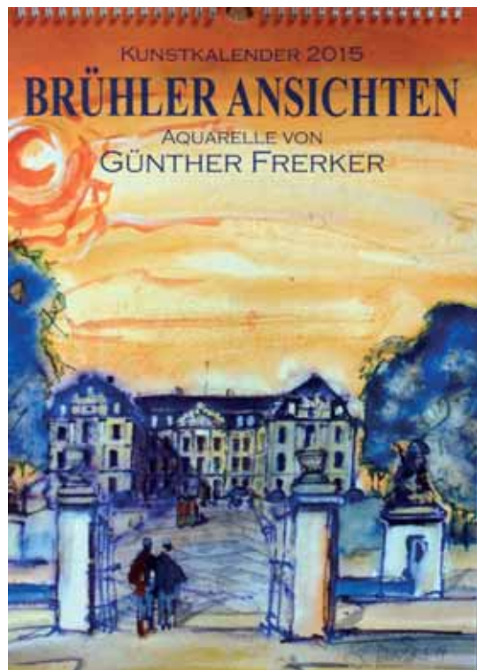
Deckblatt mit Blick auf „Abendliches Schloss Augustusburg. 30 Jahre Weltkulturerbe“

in die Schlosstraße Richtung Markt. Dieses Werk wurde nämlich von der Stadt Brühl als Jubiläumsgeschenk (aus Anlass der immerhin seit 50 Jahren bestehenden Verbindung) ihrer französischen Partnerstadt Sceaux überreicht.