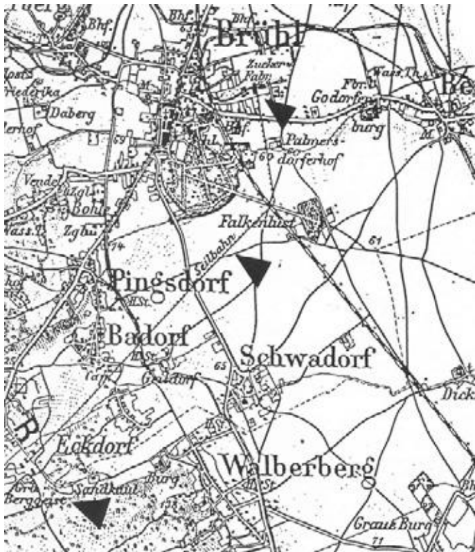
Abb. 4 Die schwarzen Pfeile zeigen den Verlauf der Braunkohlenseilbahn von der Grube Bergegeist zur Zuckerfabrik Brühl.

stehen zurückblicken. Jedoch wurde die Aufrechterhaltung der Selbständigkeit immer schwieriger. 1989 schließlich übernahm der Konkurrent der Gründungszeit, Pfeifer & Langen, die Brühler „Bauernzuckerfabrik“ und verlegte die Produktion nach Euskirchen.