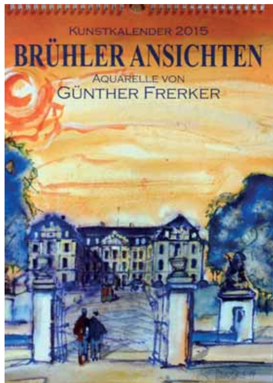
Deckblatt mit Blick auf „Abendliches Schloss Augustusburg. 30 Jahre Weltkulturerbe“

in die Schlosstraße Richtung Markt. Dieses Werk wurde nämlich von der Stadt Brühl als Jubiläumsgeschenk (aus Anlass der immerhin seit 50 Jahren bestehenden Verbindung) ihrer französischen Partnerstadt Sceaux überreicht.