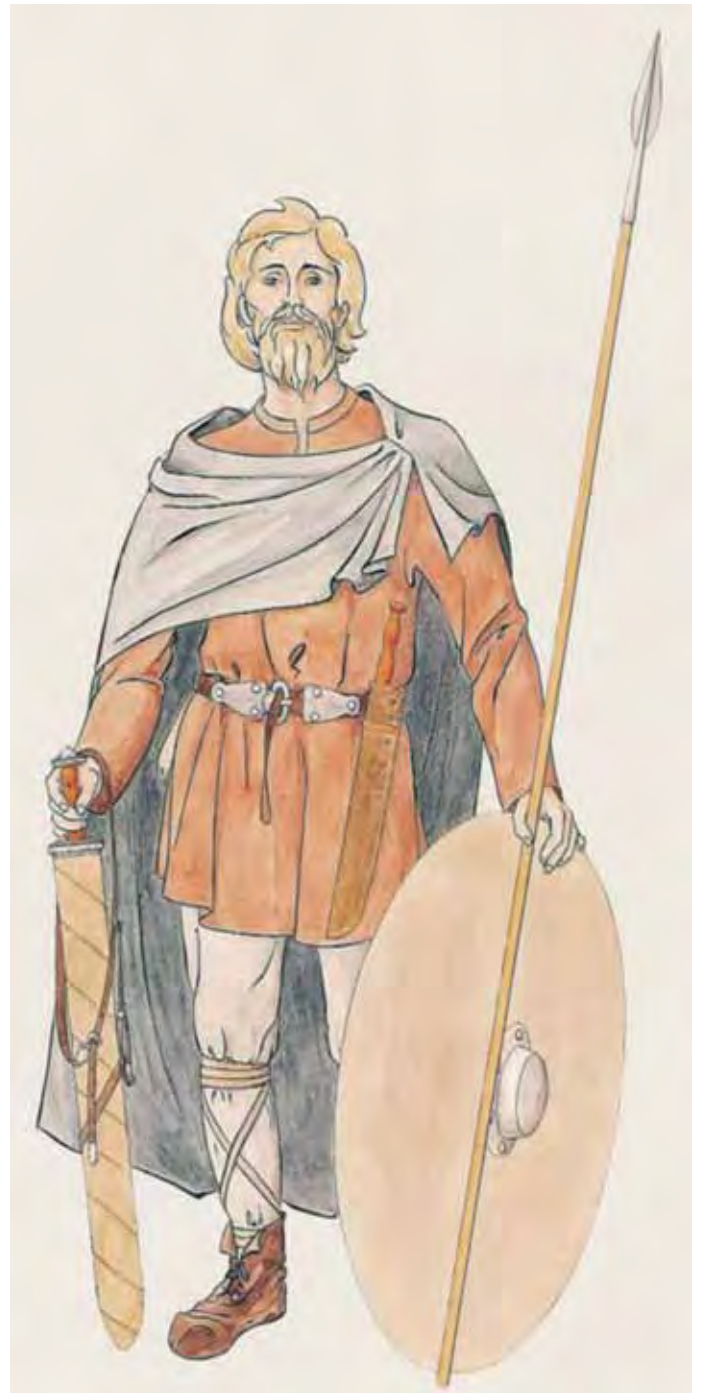
Abb. 36 Fränkische Männertracht