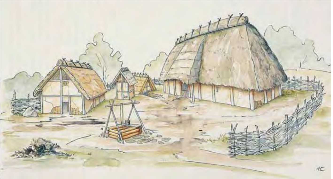
Abb. 34 Frühmittelalterliches Gehöft

Quelle: Frank Günter Zehnder und Harald Koschik (Hrsg.), Die Franken in Wesseling – Die Ausgrabungen an der Pontivystraße. Kunst und Altertum am Rhein, Bd. 142, 1997, 20 ff., Abb. 6