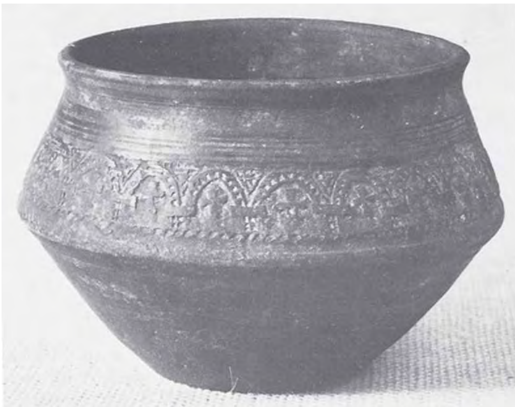
Abb. 33 Knickwandtopf

Bei großflächigen Bauarbeiten zur Unterquerung der Vorgebirgsbahn (Linie 18) für den Autoverkehr bei Brühl-Vochem wurde im Dezember 1997 ein bis dahin unbekanntes fränkisches Gräberfeld entdeckt. Da die Bestattungen die weiteren Bauarbeiten behinderten, wurde der von der Baumaßnahme bedrohte Teil des Friedhofes archäologisch untersucht. Es fanden sich rund 110 Gräber des 6. bis 7. Jahr-