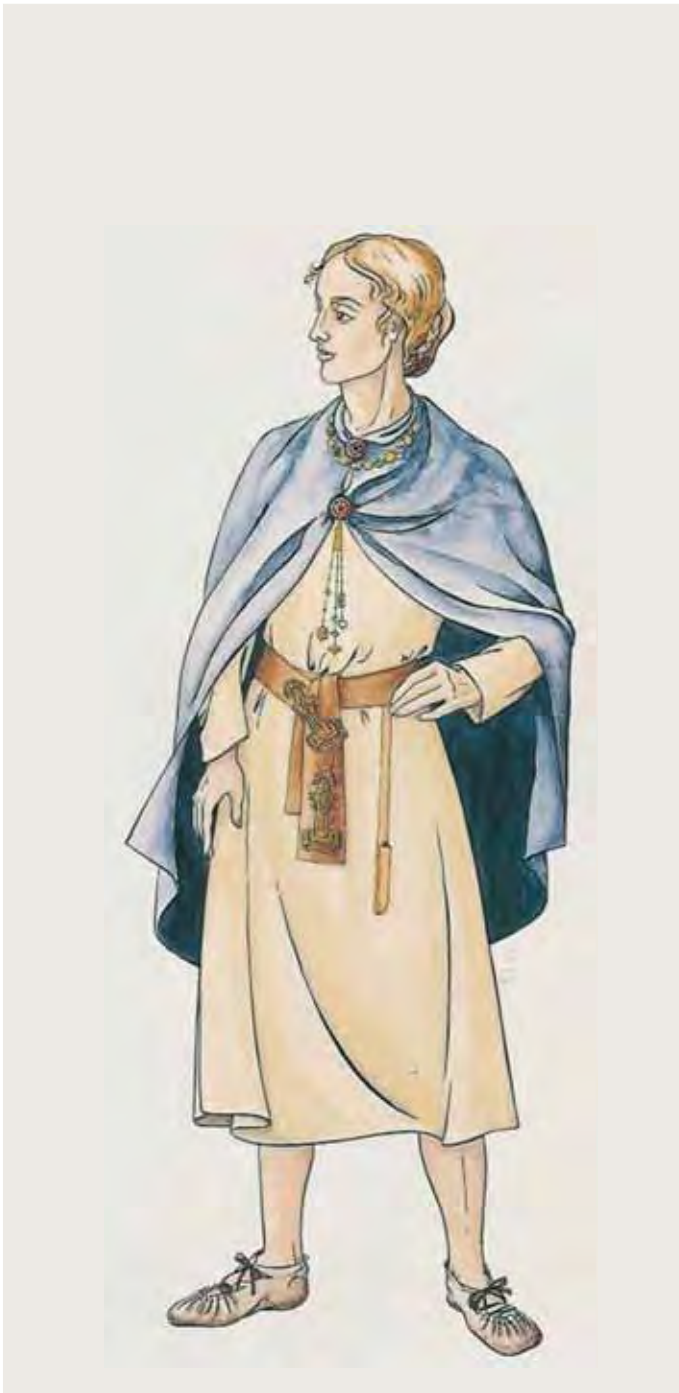
Abb. 35 Fränkische Frauentracht

konzentrationen sofort erkennbar. Die technische Weiterentwicklung in den von den Bodendenkmalpflegern heutzutage regelmäßig hinzugezogenen